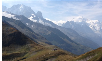
写真上) バルム峠からのシャモニー針峰群 写真右) ツェルマット村からのマッターホルン