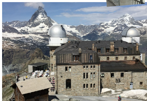
写真) ゴルナード展望台からの眺望