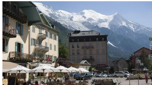
写真) フランス、シャモニーの街並