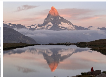
写真) シュテリゼーと朝焼けマッターホルン

この旅では、「一生に一度は見てみたい！」と憧れるフレンチアルプス・シャモニー針峰群、ヨーロッパ最高峰「モンブラン」、そしてスイスツェルマットの「マッターホルン」といったヨーロッパアルプスでも際立って特徴のある山を目の前にできる展望台へご案内します！そして、展望台からの絶景だけでなくたっぷり自然に身を置きハイキングを楽しみましょう！この季節、華やかに自然を彩る、見ていても飽きない、高山植物(もしかするとエーデルワイスも見つけることができるかもしれません)や湖に映るマッターホルン。日本では見るのが難しい氷河も規模の大きさに圧倒されること間違いありません！