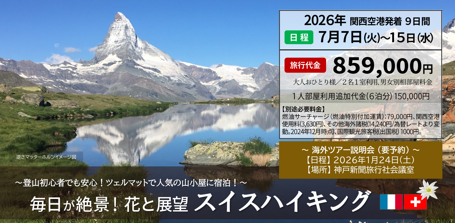
逆さマッターホルンイメージ図