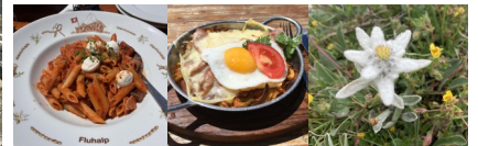
写真) 現地食事例とエーデルワイス